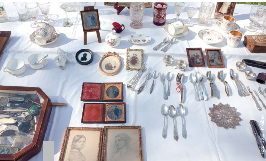
Immobilien vererben oder vermachen? Beides ist möglich.

Im allgemeinen Sprachgebrauch wird zwischen vererben und vermachen meistens kein Unterschied gemacht. Juristisch gesehen haben Erben und Vermächtnisnehmer aber ganz verschiedene Rechte und Pflichten. Erbt eine Person oder eine Erbengemeinschaft, erhält sie den gesamten Nachlass des Verstorbenen und wird Rechtsnachfolgerin des Verstorbenen. Will der zukünftige Erblasser ganz bestimmte Vermögensgegenstände, zum Beispiel Immobilien, Kunstwerke oder Geldbeträge, auf eine Person übertragen, kann er dies in einem Vermächtnis festlegen. Es ist auch möglich, ein befristetes Wohnrecht als Vermächtnis zu übergeben. Ein zukünftiger Erblasser kann seinen Nachlass mit einer testamentarischen Verfügung detailliert regeln. Er kann beispielsweise eine Person als Erben einsetzen und alle anderen durch ein jeweiliges Vermächtnis in der rechtlich angemessenen Höhe beteiligen.